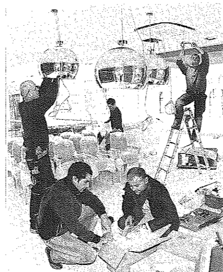
Das Modehaus Il Mondo öffnet an diesem Sonnabend auf 1150 Quadratmetern.